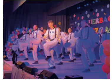
Die Hohner Stifterappeler

der Bühne und zu DJ Knuts Partyhits tanzte auch der Saal bis in die frühen Morgenstunden. Für weitere Infos und Eindrücke folgen Sie gerne der Beuerbacher Tanzgaudi auf Facebook oder Instagram. Für nächstes Jahr darf sich bereits der 28. Februar notiert werden.(kok)