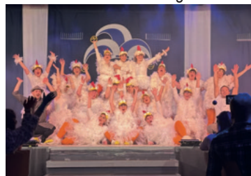
Die Bodyfit Ladies