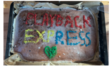
Lecker Playback Express Kuchen

con Carne, Flammflachs oder Crepes und Kuchen: Es war für alle etwas dabei. Bei schönstem Wetter und dem ein oder anderen ‚heißen Horst‘ oder Glühwein, konnten die Gäste noch einmal über das vergangene Jahr philosophieren und die letzten Stunden des Jahres genießen.