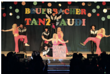
Die Miesfeller Dancing Cowboys

Die Damen von „Mirage“ aus Haintchen waren als Wikinger Krieger erstmals auf der Tanzgaudi Bühne zu