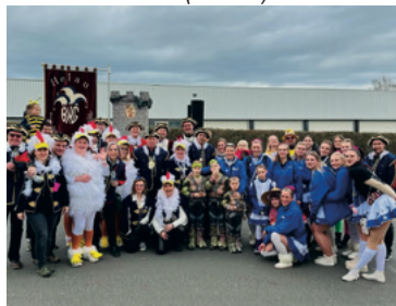
BNG & Friends beim Handkarrenumzug in Bad Camberg