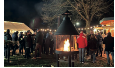
Schöne Stimmung am „Lagerfeuer“

In den Abendstunden liess es sich an Feuertonne und offenem Grill noch lange an ‚usser Hiddje‘ aushalten. (sg)