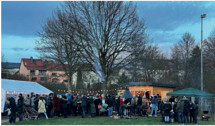
Viele Besucher und bestes Wetter. Der Jahresabschluss vom Playback Express am „Hiddje“

Am 30. Dezember veranstaltete der Playback Express am Weinstand an der Mehrzweckhalle ein Abschlussfest für klein und groß. Ab Mittag bis