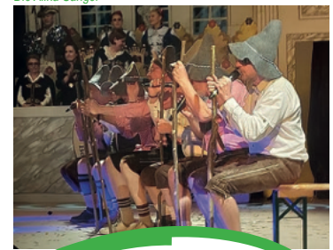
Die Allka Sänger

Der Turn- und Sportverein 1903 Beuerbach e.V.